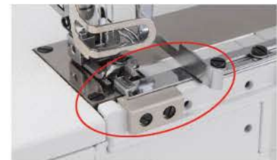
Costura tipo bainha