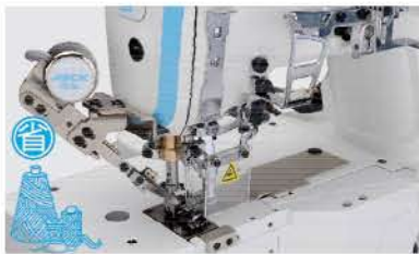
Corte de linha automático