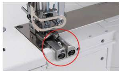
Costura tipo cobertura