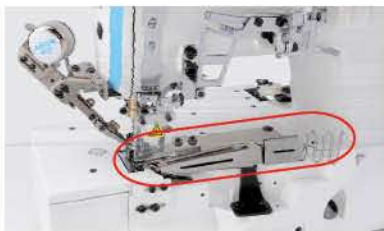
Aplicação de galão