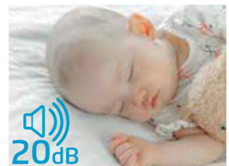
Baixa emissão de ruído, através do motor de passo.