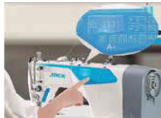
Ajuste do tamanho do ponto digital