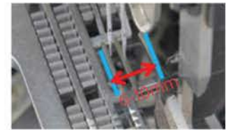
Disponível em bitolas leve, médio e pesado