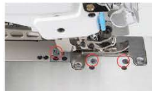
Sensor inteligente para reconhecimento de tecido