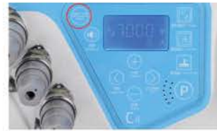
Reset de fábrica