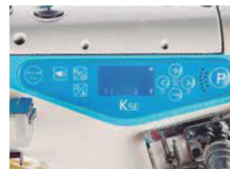
Painel fácil de operar