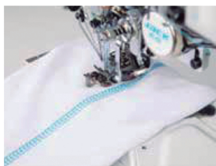
Corte de linha do trançador