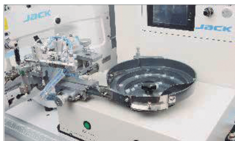
Bandeja de alimentação automática