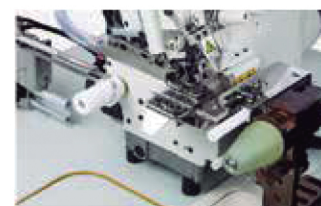
FR09: Aplicador de goma automática