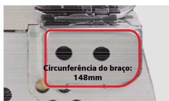
Circunferência do braço: 148mm