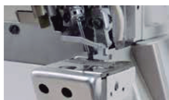
Sistema de transporte do calçador