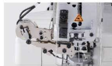
Caça linha opcional