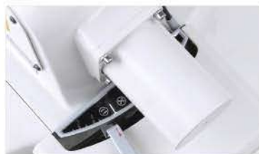
Amarração em "x" e "="