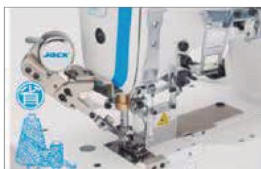
Corte de linha automático