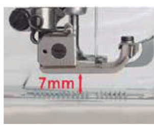
Altura do calcador até 7mm