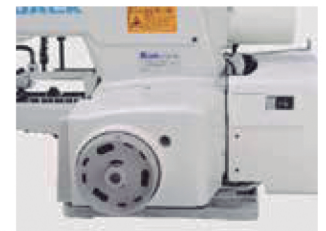
Motor integrado no cabeçote