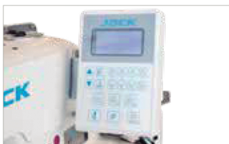
Apliação botão de 2 e 4 furos