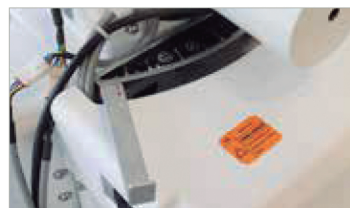
Amarração em "x" e "="