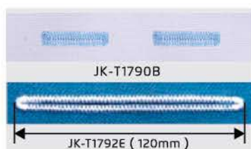
Caseado com até 120mm