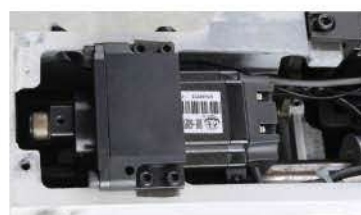
Sistema de corte com motor de passo