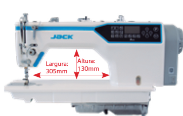
Espaço de trabalho ampliado