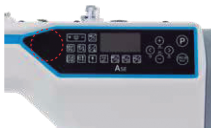
Comando de voz