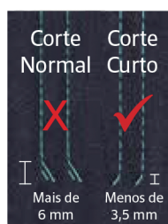
Corte de linha curto