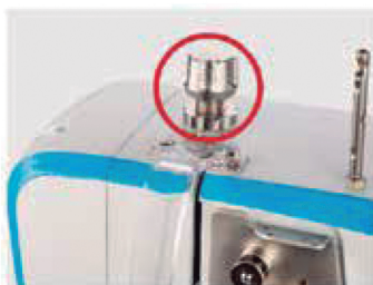
Mecanismo para ajuste de pressão do rodízio