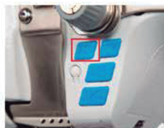
Ajuste digital do tamanho do ponto