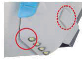
Luz de LED com 3 estágios