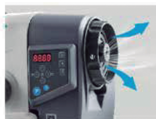
Volante com ventilação