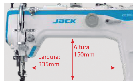
Espaço de trabalho ampliado