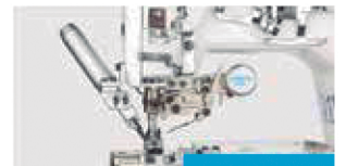
Própria para bainhas cilíndricas de barra de camisa e mangas