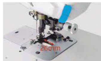
Abertura do refilador