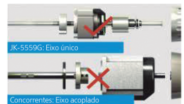
Eixo único, leveza e velocidade