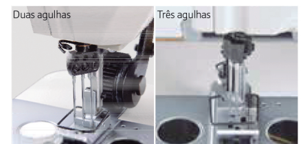
Disponível em 2 bitolas (JK-8560G)