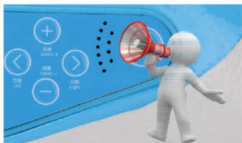
Comando de voz