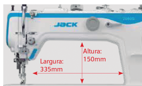
Espaço de trabalho ampliado