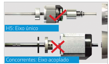
Eixo único, leveza e velocidade