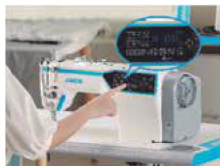
Ajuste do tamanho do ponto digital.