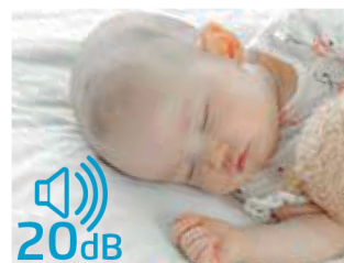
Baixa emissão de ruído, através do motor de passo.